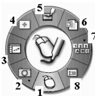
Рис. 3. Меню инструментов рабочего стола. Активный элемент выделен:

1 – переключение стилуса в режим мыши; 2 – захват изображений и видео с экрана монитора; 3 – работа с альбомом (книга подшивок); 4 – калибровка доски; 5 – маркер; 6 – презентация; 7 – виртуальная (экранная) клавиатура; 8 – настройка интерактивного маркера (стилуса)